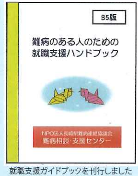
就職支援ガイドブックを刊行しました