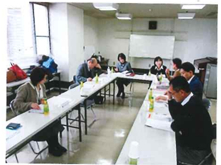
△運営委員会の様子

今後とも課題をひとつひとつ解決し、難病患者さんに適切なアドバイスと支援ができますよう、職員一同頑張りますので、よろしくお願いいたします。